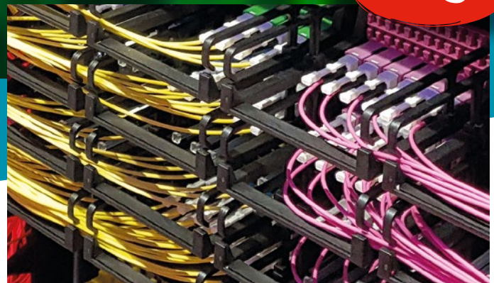
HIGH-DENSITY DATACENTER SOLUTION (HD-DCS)

Die FO-DCS ist eine zukunftssichere, vorkonfektionierte Plug-and-Go-Glasfaserlösung, die sich durch hochwertige Kabel und Komponenten und eine hochpräzise Steckerkonfektion auszeichnet. Aufgrund ihrer exzellenten optischen und geometrischen Werte eignet sie sich für alle aktuellen sowie für zukünftige High-Speed-Anwendungen im Datacenter. Modulare, beliebig kombinierbare Bauteile bieten Anwendern ein Höchstmaß an Design-Flexibilität.