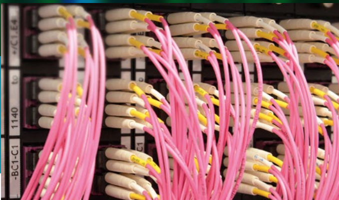
DÄTWYLER DATACENTER SOLUTION (FO-DCS)