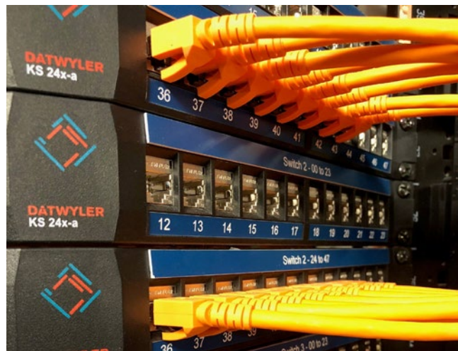
Die Lösungen von Dätwyler Cabling Solutions überzeugen durch hohe Qualität und Zukunftssicherheit.

ierung (Bewertung) und Autorisierung (Zulassung) von chemischen Stoffen in der Europäischen Union. RoHS (EG-Richtlinie 2011/65/EU) verbietet bestimmte Substanzen bei der Herstellung und Verarbeitung von elektrischen und elektronischen Geräten. Durch standardisierte Prozesse in der Auswahl der Rohstoffe sowie durch Sicherheitsdatenblätter für alle Produkte erfüllt Dätwyler Cabling Solutions in den bearbeiteten Ländern die relevanten gesetzlichen Vorgaben und Normen bezüglich stofflicher Zusammensetzung und Transparenz. Für die zugekauften Komponenten übernimmt Dätwyler Cabling Solutions die Verantwortung, dass die importierten Produkte den nationalen Gesetzen und Normen entsprechen. Über die Abgabe von Spezifikationen an die Lieferanten und die Kontrolle der Produkte unter anderem über Sicherheitsdatenblätter wird diese Verantwortung wahrgenommen.