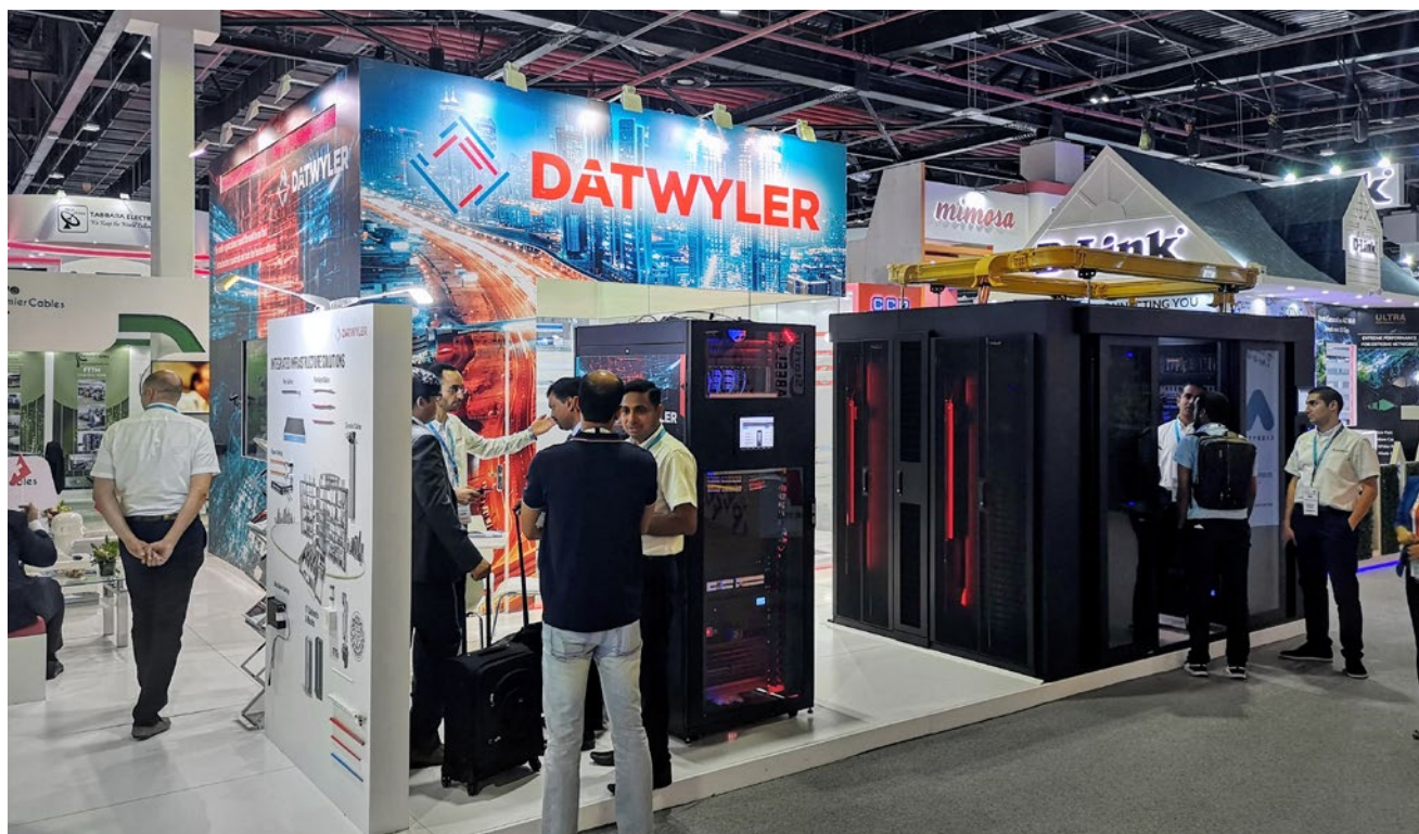
Dätwyler Cabling Solutions ist regelmässig an Fachmessen präsent und führt pro Jahr mehr als 100 Kundens Schulungen mit mehr als 1'200 Teilnehmern durch.

Dätwyler Cabling Solutions führt regelmässig eine einheitliche Kundenumfrage durch. Die Umfrageergebnisse liefern wertvolle Grundlagen zur Erarbeitung und Umsetzung von Verbesserungsmaßnahmen. Diese sind Teil des systematischen Führungsprozesses und tragen damit zu einer kontinuierlichen Optimierung der Leistung für die Kunden von Dätwyler Cabling Solutions bei.