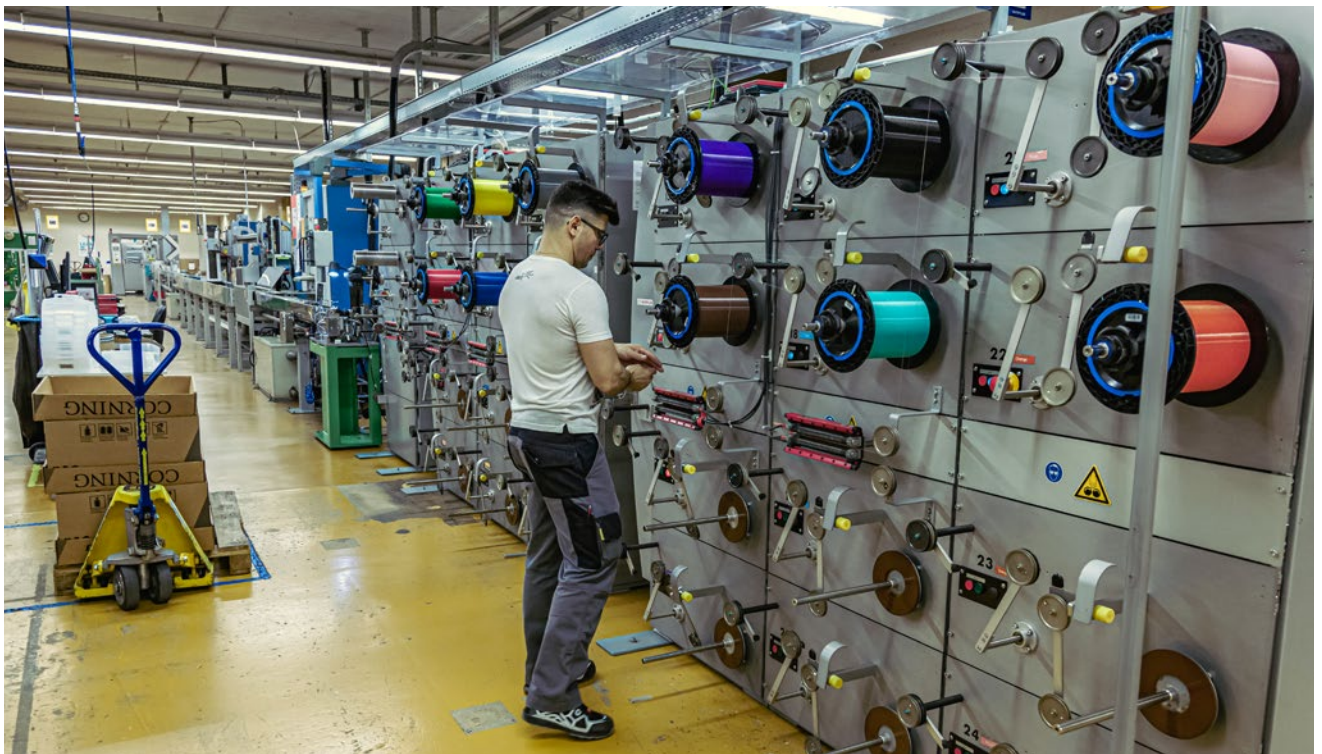
Dätwyler Cabling Solutions sorgt für ein sicheres und gesundes Arbeitsumfeld, wie hier in der Fertigung für Glasfaserkabel.

Dätwyler Cabling Solutions führt regelmässig an allen Standorten eine einheitliche Mitarbeiterumfrage durch. Die Umfrage wird mit einem schriftlichen Fragebogen in den lokalen Sprachen in Zusammenarbeit mit einem externen Spezialisten umgesetzt. So ist die Anonymität der Mitarbeitenden gewährleistet. Das Konzept der Umfrage basiert auf der Idee des Benchmarkings. Durch die Erfahrung des externen Spezialisten ist es möglich, die Resultate von Dätwyler Cabling Solutions mit einem Pool von rund 20'000 Schweizer Angestellten zu vergleichen. Die Mehrheit der Standorte von Dätwyler Cabling Solutions liegt im Rahmen des externen Benchmarks. Die Umfrageergebnisse liefern wertvolle Grundlagen zur Erarbeitung und Umsetzung von Verbesserungsmassnahmen. Die Massnahmen zur Steigerung des Commitments der Mitarbeitenden sind Teil des systematischen Führungsprozesses.